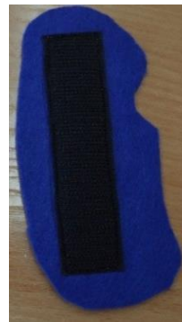
Рисунок 2. Обратная сторона героев сказки.