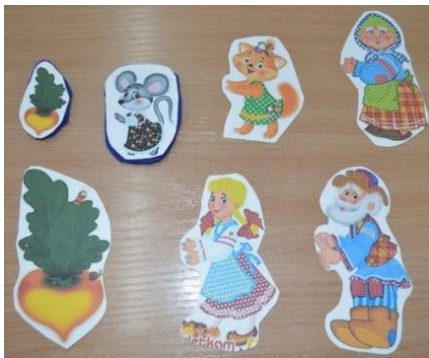
Рисунок 1. Герои сказки репка.