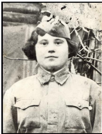
Рис.2 Пример обработанной фотографии

При изучении темы «Графическая информация» обучающиеся осуществляли процесс редактирования, ретуширования, улучшение качества изображения фотографий средствами графических редакторов: Paint, PixBuilder Studio.(9 класс) (Рис.2)