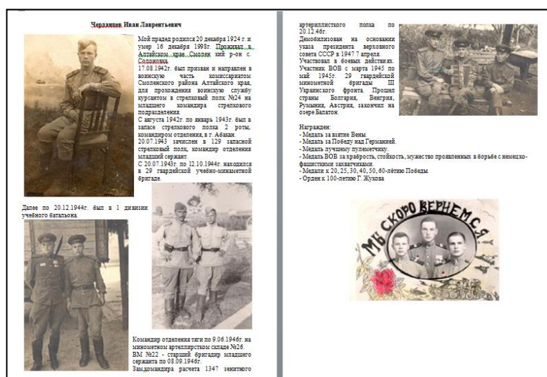
(7-8 класс). Примеры разработанного материала для сайта (Рис.1)

В рамках урока и программы по информатике, при изучении тем «Текстовый процессор Microsoft Word» и «Создание мультимедийных презентаций средствами Microsoft PowerPoint», обучающиеся создавали свою историю о судьбах своих родных и близких, о подвигах, которые совершили не только всем известные герои, но и их родственники.