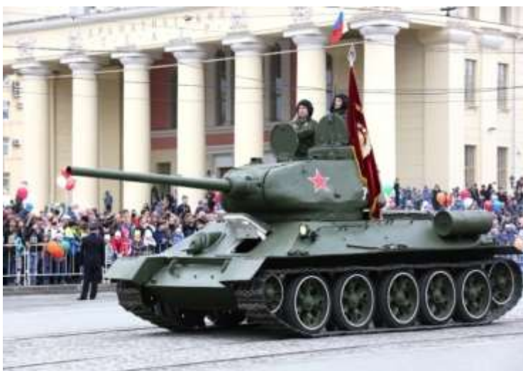
РИСУНОК 1. ПАРАД 9 МАЯ В Г. НИЖНИЙ ТАГИЛ [5].

Каждый год в нашем городе проходит Парад, посвященный Дню Победы в Великой Отечественной войне.