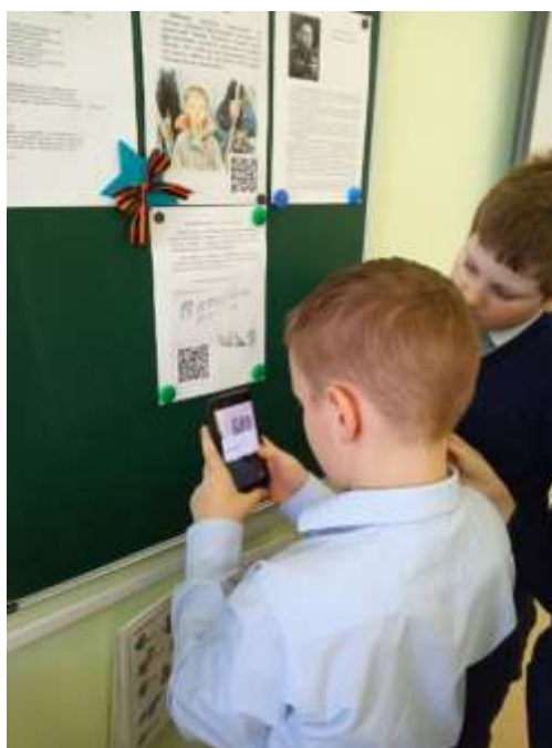
Рис. 1. Стенд «Читаем о войне»

На втором этапе нашей работы мы подготовили стенд «Читаем о войне», ребята изготовили заголовки для стенда, принесли массу интересных сведений для размещения на нем. На этом стенде мы стали размещать отобранные рассказы, а так же заметки и аннотации с qr-кодом (рис. 1).