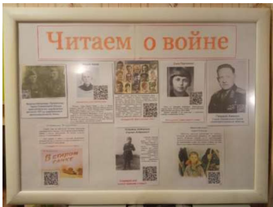
Рис. 4. Оформленный стенд «Читаем о войне»

В настоящее время стенд имеет вот такой вид как на рис.4.