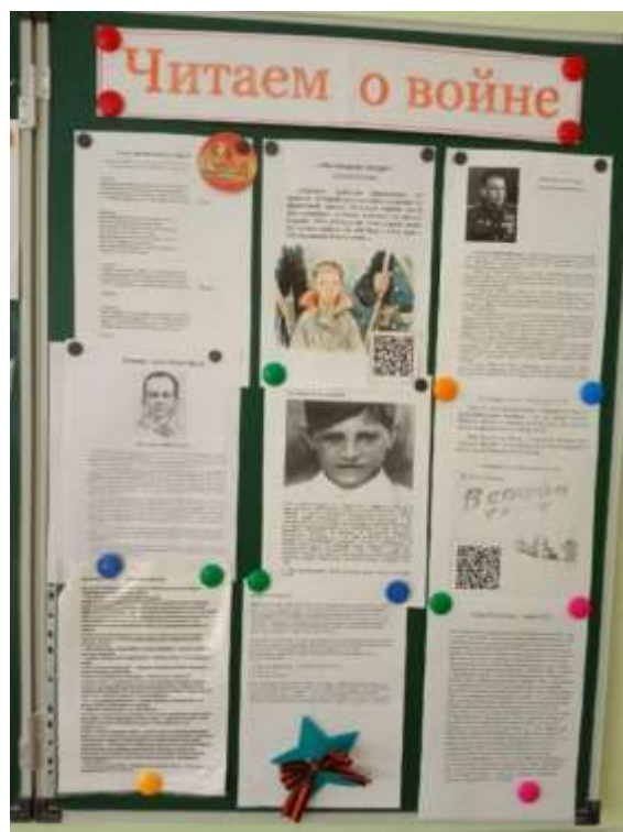
Рис.3. Стенд на конец апреля