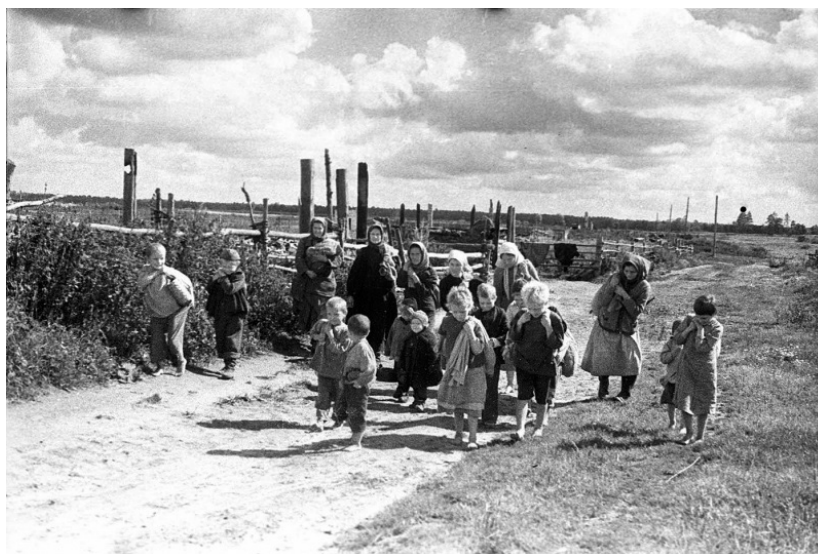
«Жители освобожденного г. Жиздра возвращаются в город»