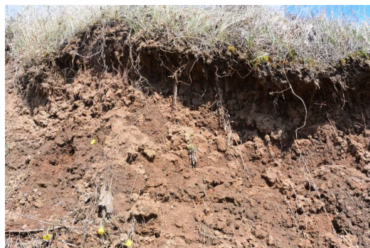
Фото 10. Стенка срыва оползня

На данных склонах наблюдаем 5 оползней. В ходе проведения практической работы выполнили замеры оползней, произвели отбор проб грунта (общее количество 10), для определения состава и увлажненности.