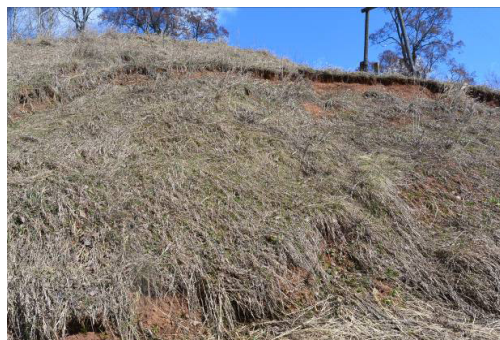
Фото 7. Склон 4. Оползень 4