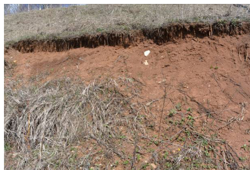
Фото 8. Склон 4. Оползень 4