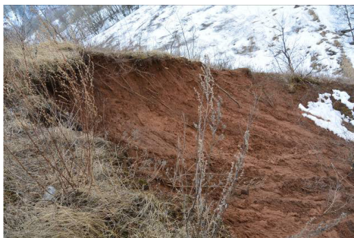
Фото 2. Рыхлые грунты склонов