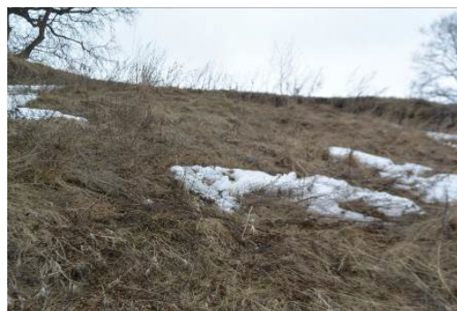
Фото 9. Оползень 5