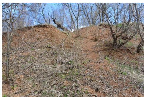
Фото 5. Склон 2. Оползень 3