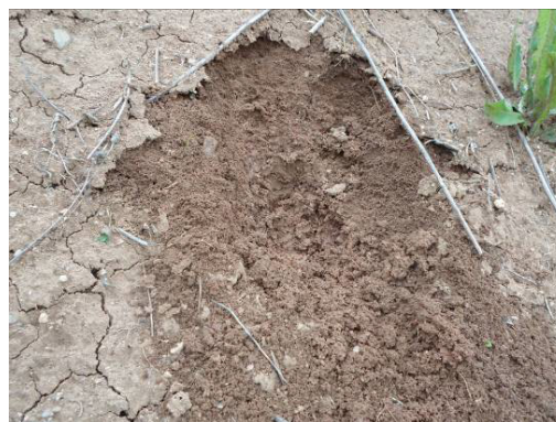
Фото 1. Рыхлые грунты склонов

На основе наблюдений за динамикой оползневых процессов и скорости смещения почвенной породы в данном случае можно отметить, что на момент 2010 года они относились к категории медленных, ползучих смещений рыхлых отложений. По анализу почвы можно заключить, что это легкий, мореный суглинок коричневого цвета (окраска почвы по С.А.Захарову) в котором присутствует мелкий гравий до 10%, не пылеватый, покровный, что говорит о возможности резкого снижения прочности и увеличению сжимаемости грунта при намокании, снижения прочностных характеристик при динамических воздействиях. Рыхлые грунты состоят в основном из скоплений отдельных зёрен и частиц. Связность этих скоплений зависит от внутреннего сцепления и трения между зёрнами. Установлено, что разрушение склона, сложенного из рыхлых грунтов, происходит при сдвиговых деформациях (фото 1, 2).