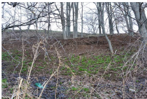
Фото 3. Склон 1. Оползень 1

Исследования проводились на трех склонах, условно обозначенных 1, 2, 4, на которых прослеживаются активные оползневые процессы (фото 3–10).