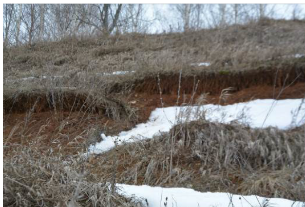
Фото 11. Оползень 4

Исходя из того, что мы наблюдаем выход грунтовых вод на береговых склонах,