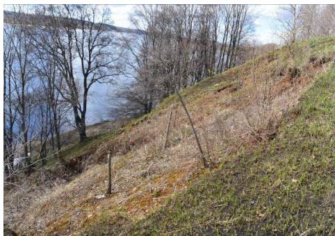
Фото 4. Склон 1. Оползень 2