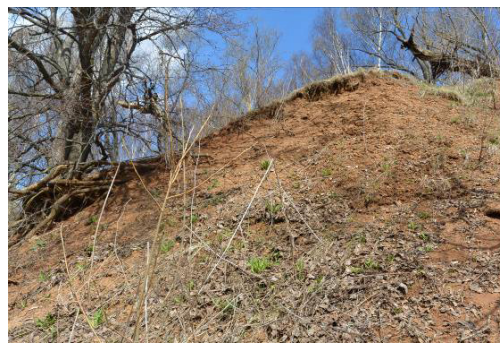
Фото 6. Склон 2. Оползень 3

Практическая работа на оползневых склонах (30 апреля 2018 года).