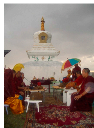
Фото 2. Освящение СУБУРГАНА