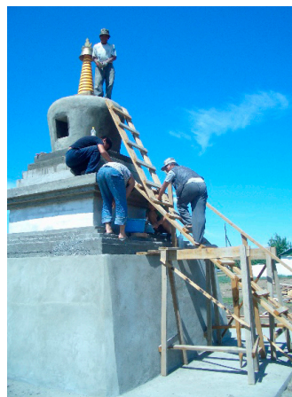
Фото 1. Строительство СУБУРГАНА