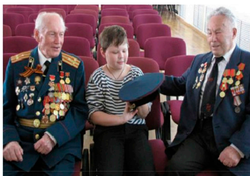
На одном из ежегодных уроков мужества с Крановым И.Б., 2013 год