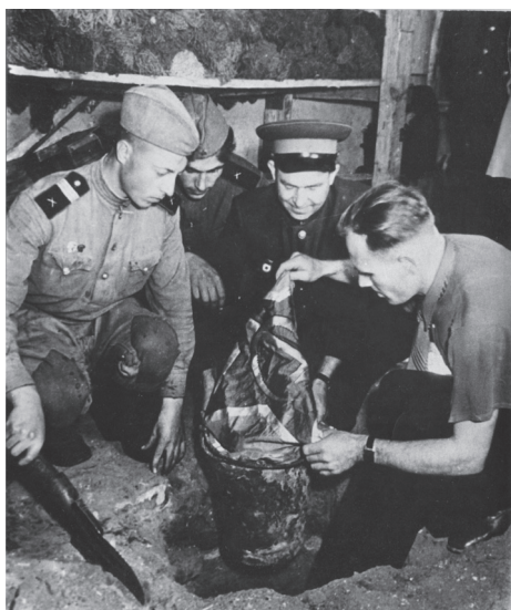
Нахождение спасенного боевого знамени

Копия. ГАРНИЗОННЫЙ ДОМ ОФИЦЕРОВ гор. Брест II октября 1956 г. № 372 СПРАВКА