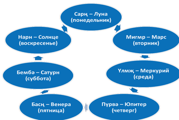
ДОЛАН ХОНГ – ДНИ НЕДЕЛИ

П.А. Алексеева отмечает, что «Калмыцкие зурхачи (астрологи) так называемые «несчастливые» дни – « хар өдр », « түшгтэ өдр » – исключали из числа дней месяца, таким образом то или иное число в календаре отсутствовало совсем. День, не обозначенный числом, назывался « тасрха өдр », Например, после 5-го сразу шло 7-е число. А чтобы набрать соответствующее количество дней месяца (30 или 29 дней), некоторые числа повторялись и назывались они « давхр өдр », в отличие от « тасрха өдр », считаясь благополучными. В дни « тасрха өдр » (или « хар өдр ») избегали совершать важные дела» [1]. Все эти знания необходимы человеку в его повседневной жизни.