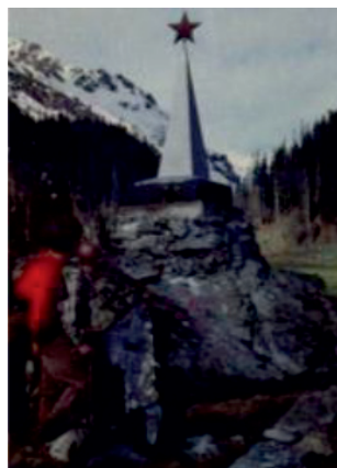
10. Памятник на перевале Санчара