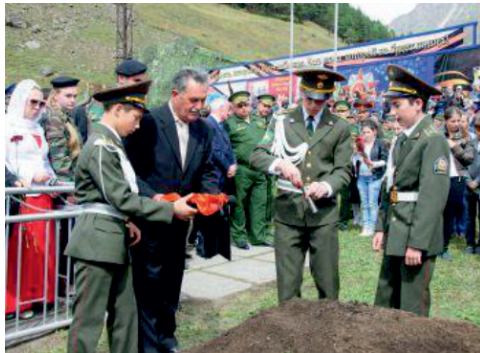
3. Торжественное захоронение останков солдат в Терсколе в 2014 г.