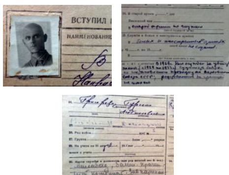
8. Документы и фото Григорьянца Г.А.