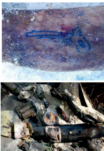
9. Фото тату на руке лейтенанта и одежда бойцов