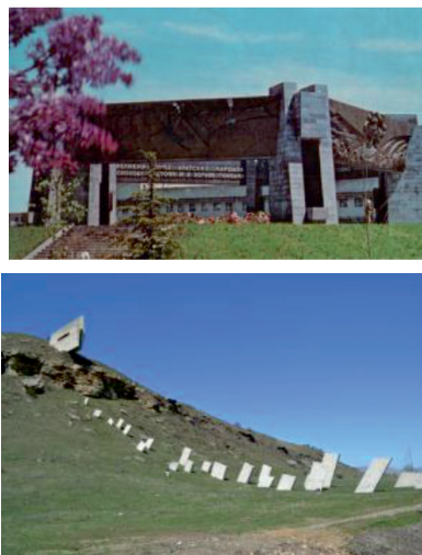
11. Музей, посвященный защитникам перевалов Сев. Кавказа