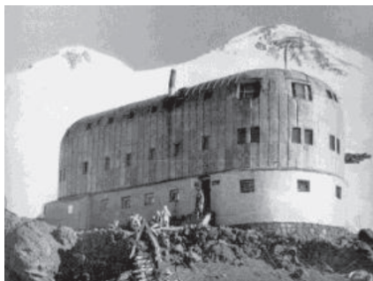
5. Приют 11