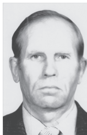
Рис. 1. Борис Михайлович Стаканов