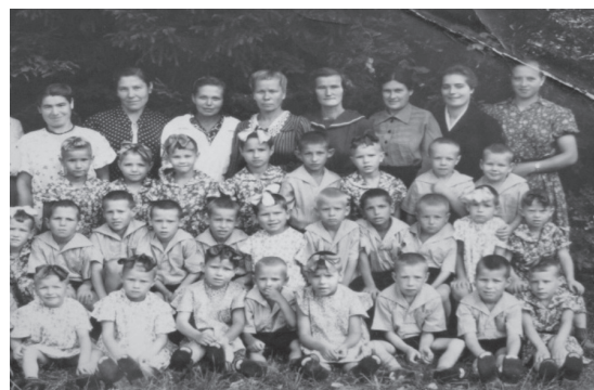
Рис. 4. Сотрудники и воспитанники Беляевского детского дома. (к.1940-х – 50-е гг.)