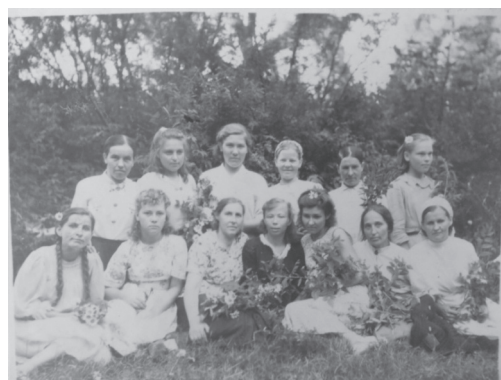
Рис. 3. Сотрудники Беляевского детского дома. 1947 г.