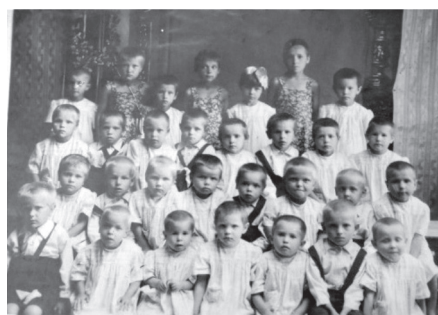
Рис. 6. Малышковая группа 1. 1947 г.