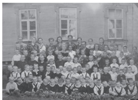
Рис. 2. Беляевский детский дом (1950-е гг.)