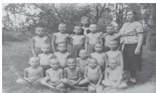
Рис. 5. Группа старших мальчиков. 1947 г.