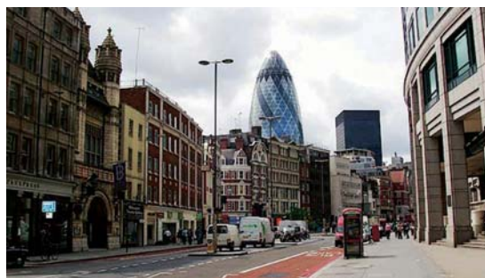
Сити – район Лондона.

А как же принято одеваться в Англии? Прочитав книгу, я узнала, что, например, в Сити почти все ходят в шляпах и строгих костюмах. Это центральный район Лондона, где находятся банки, конторы и другие солидные учреждения; поэтому и одеваться там полагается солидно.