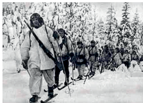
В Красной Армии, в середине Великой Отечественной войны была введена камуфляжная форма для снайперов, разведчиков, саперов, диверсантов.