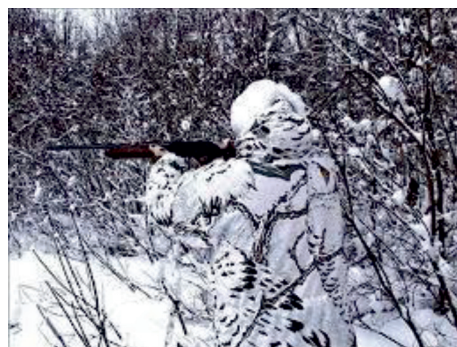
В годы Второй мировой войны широко использовались белые маскхалаты во всех армиях мира.