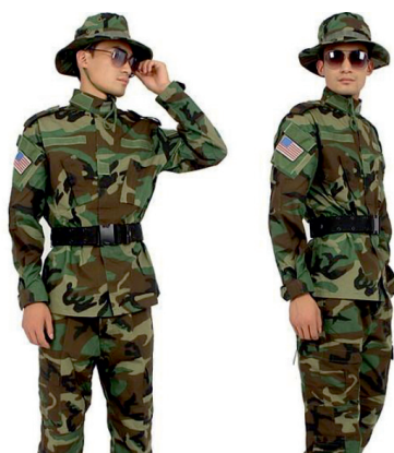
– «Буш» – имеет мало видов и используется нечасто, в основном на Юге Африки;